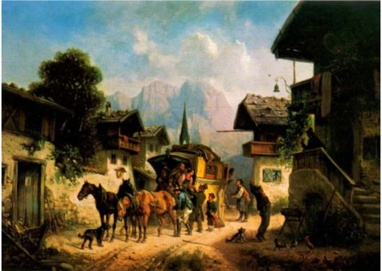
Ankunft der Postkutsche in Garmisch ca. 1840