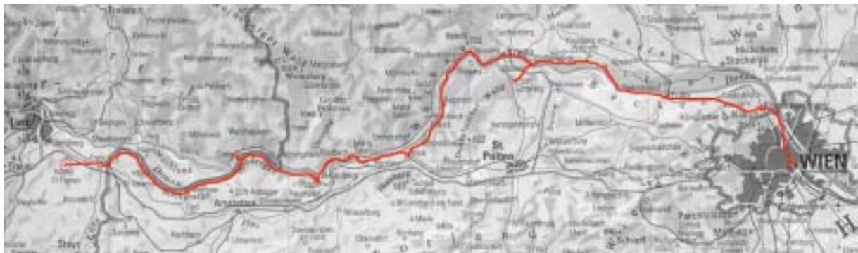
Unsere Reiseroute Linz - Wien