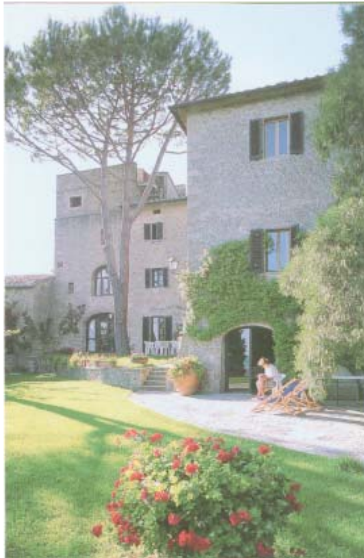
Peruzzo – il giardino