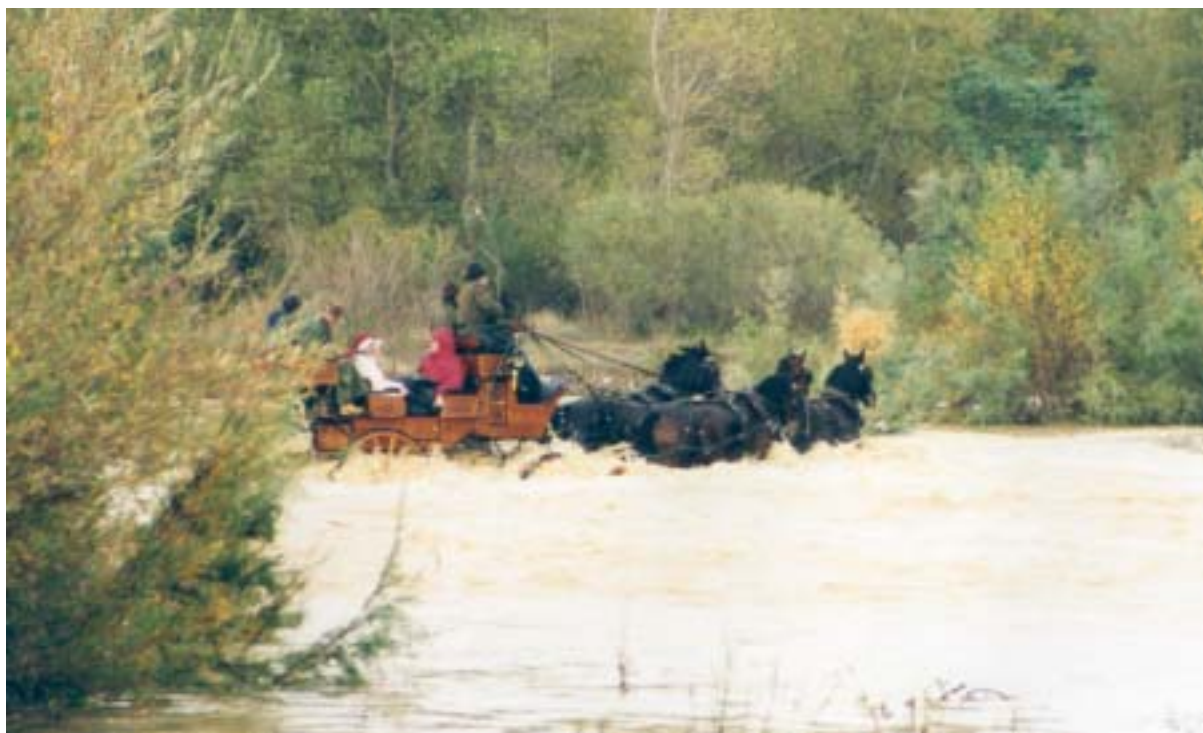
Überquerung des Ombrone bei Hochwasser